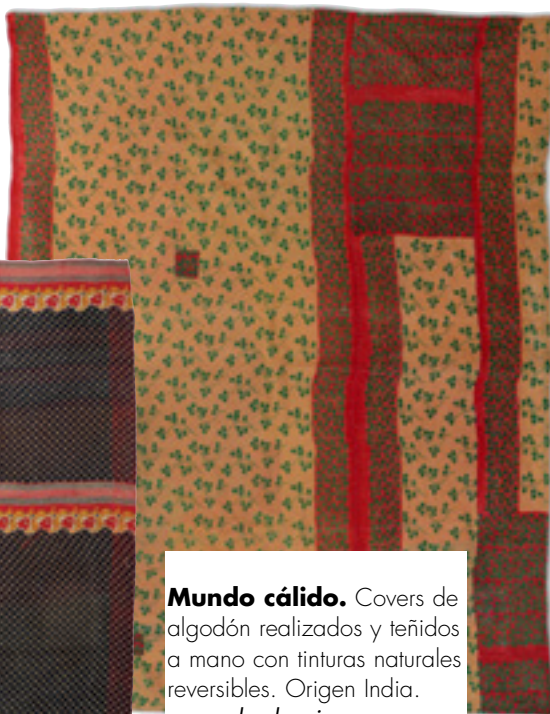
Mundo cálido. Covers de algodón realizados y teñidos a mano con tinturas naturales reversibles. Origen India. www.desdeasia.com.ar

Mesas couture. Miguel Esmoris, unos de los más destacados fotógrafos de moda, retrató la Casa de Gianni Versace en Miami allá por los '90. Esa foto y algunas otras más, se plasmaron sobre papel y se convirtieron en individuales de mesa. Genial idea en paquetes de 24 unidades. www.ensesbazar.net