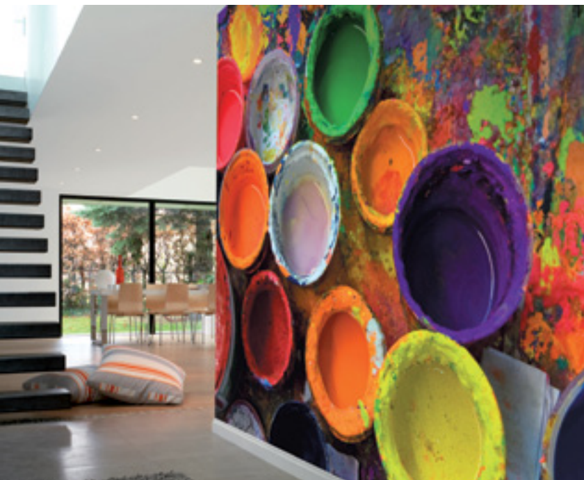
Paredes que hablan. La vuelta al empapelado en todas sus versiones, en este caso, mural diseño de Factory de la colección So Wall de origen francés. raldua.design@gmail.com

TELEX/ Nomo es un estudio de diseño de muebles de fabricación nacional. La colección está realizada en hierro y madera de paraíso cruda inspirada en lo industrial y el diseño nórdico. En cada pieza, la estructura de hierro está a la vista, generando una buena convivencia con muebles de diferentes estilos. www.nomoestudio.com.ar